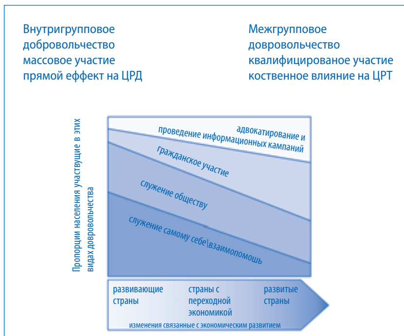
Рисунок 2. От внутригруппового к межгрупповому добровольчеству. Изменяющиеся соотношения на пути к развитию

армию. Все это сказалось на мотивации как к внутригрупповому, так и к межгрупповому добровольчеству. Конечно, такие милитаристские и националистические движения не соответствуют стандартному определению добровольчества, потому что они, во-первых, не носили мирного характера, а, во-вторых, не уважали прав человека 53 . Однако гуманная реакция на последствия войны вовлекла на легитимной основе еще большее число людей как во внутригрупповое, так и в межгрупповое добровольчество.